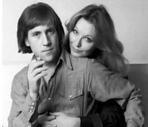
Владимир Высоцкий и Марина Влади.

Родился Высоцкий в Москве в семье гвардии полковника и переводчицы с немецкого языка.