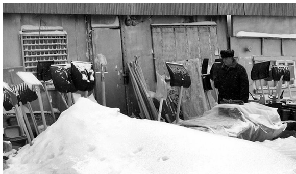
Самый ходовой товар.